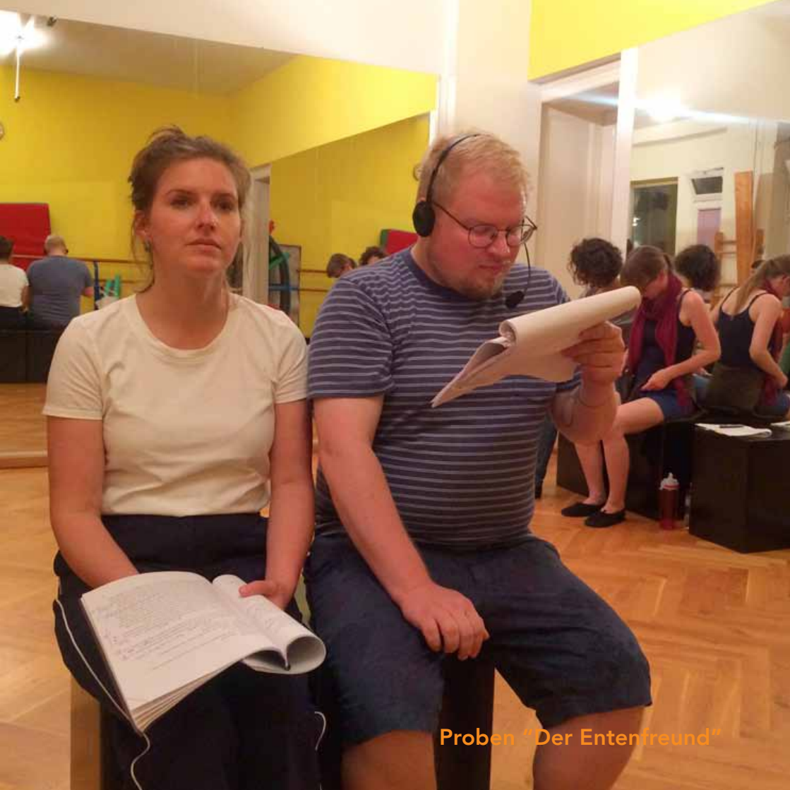
Proben "Der Entenfrend"