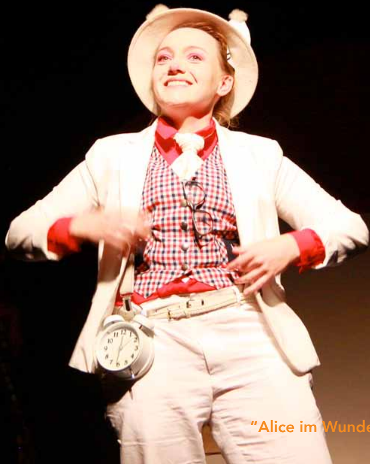
"Alice im Wunderland"