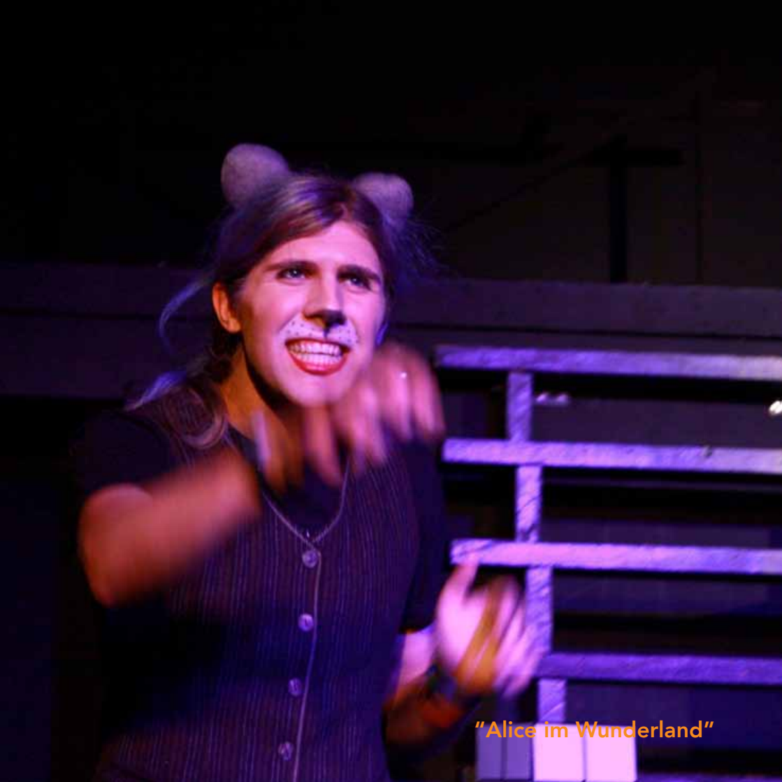
"Alice im Wunderland"