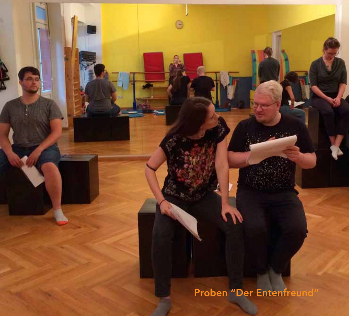
Proben "Der Entenfrend"