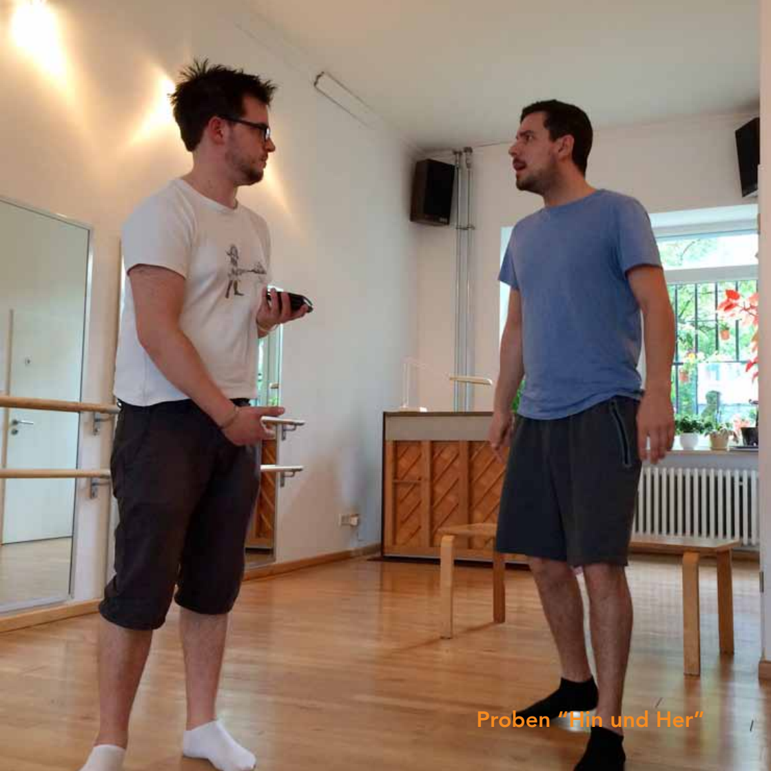
Proben "Hin und Her"