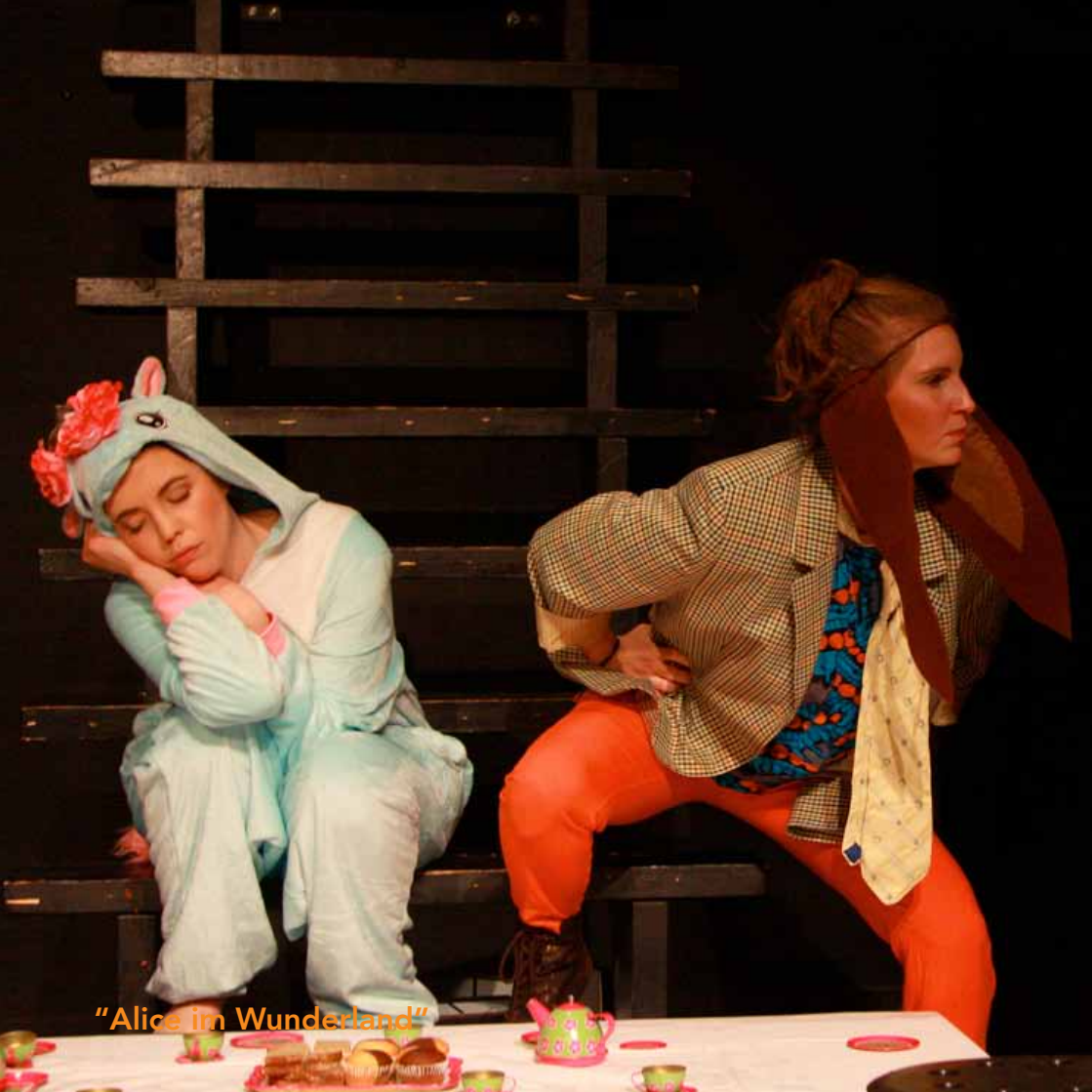
"Alice in Wonderland"