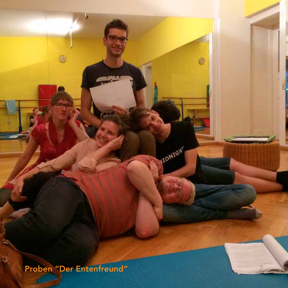
Proben "Der Entenfrend"