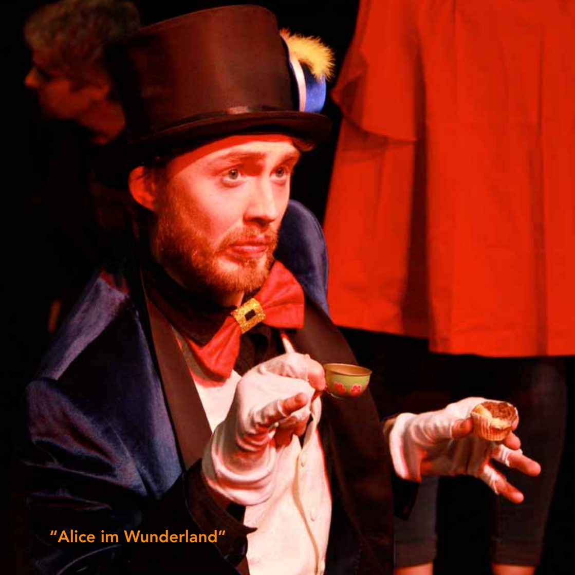
"Alice im Wunderland"