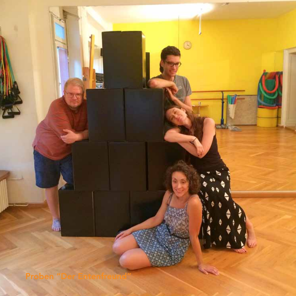
Proben "Der Entenfrend"