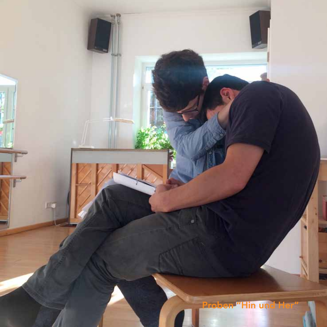
Proben "Hin und Her"