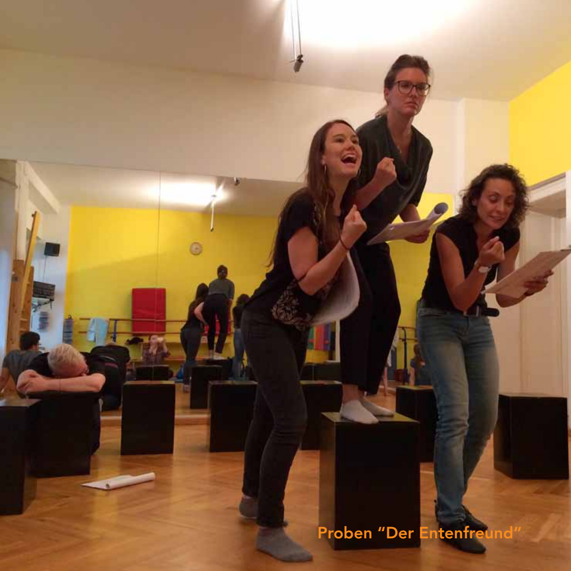
Proben "Der Entenfreund"