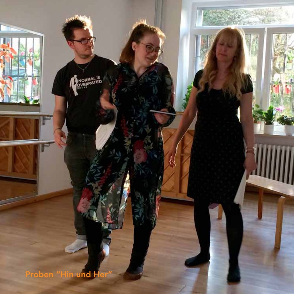
Proben "Hin und Her"