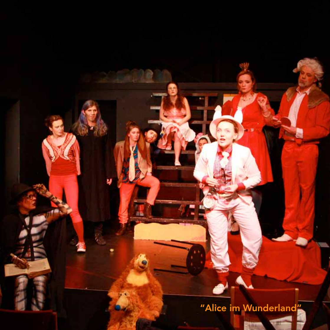
"Alice im Wunderland"