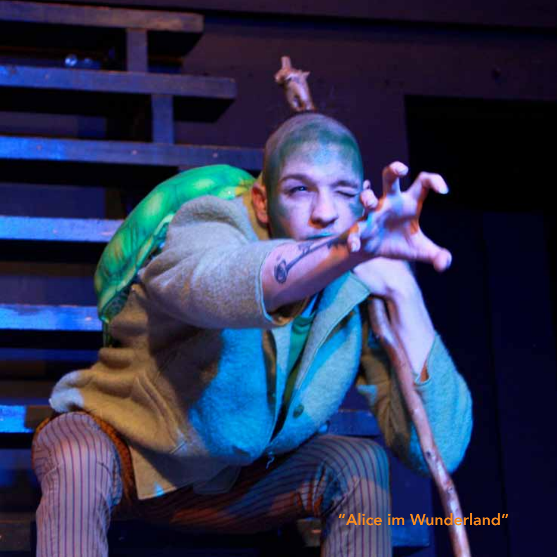
"Alice im Wunderland"