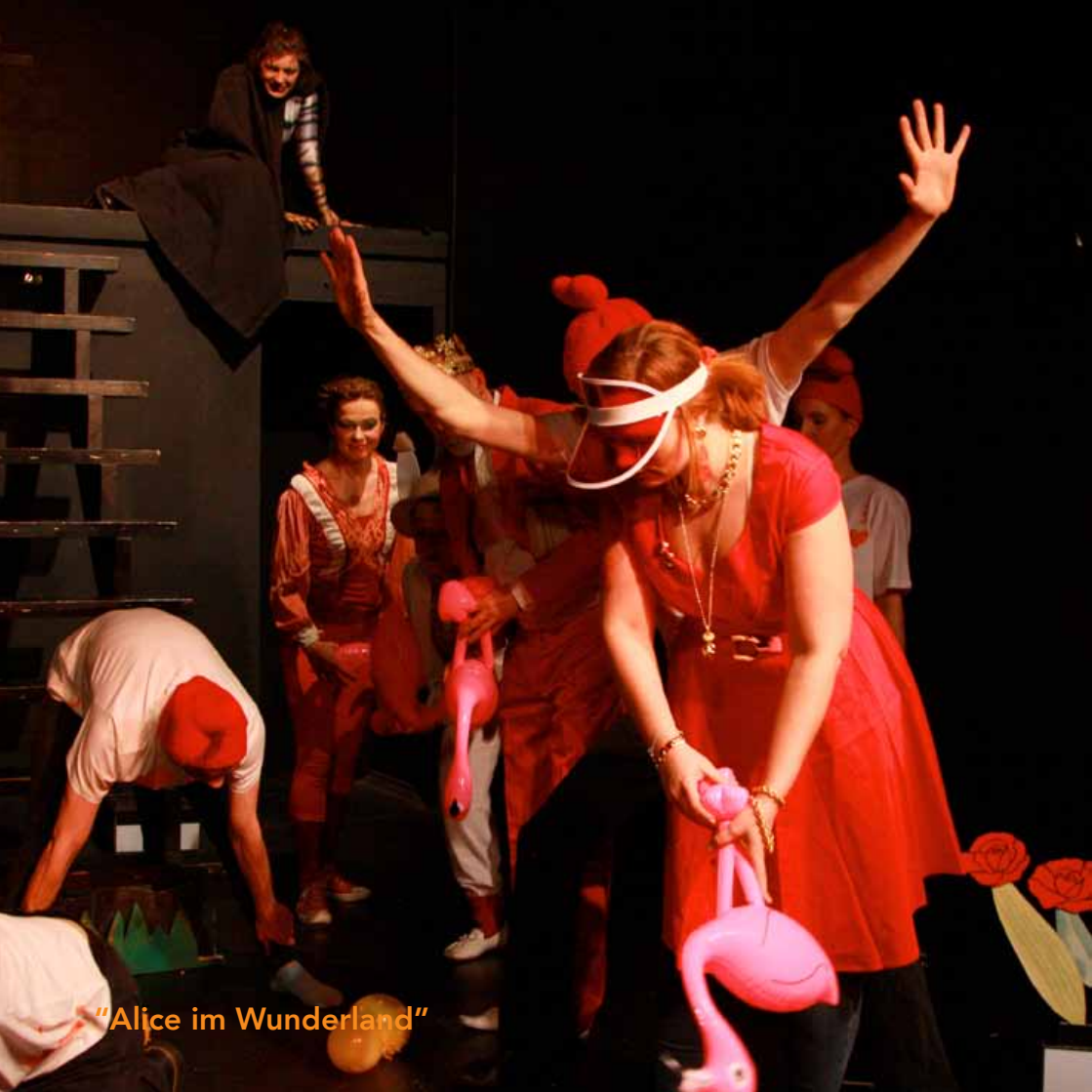
"Alice im Wunderland"