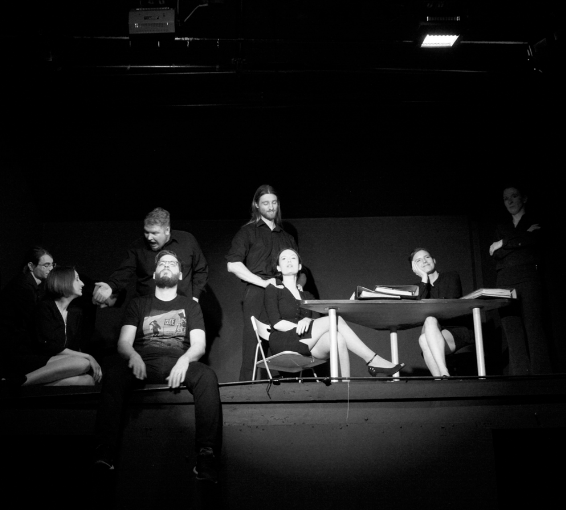
Probenbild "DREAMS INC."