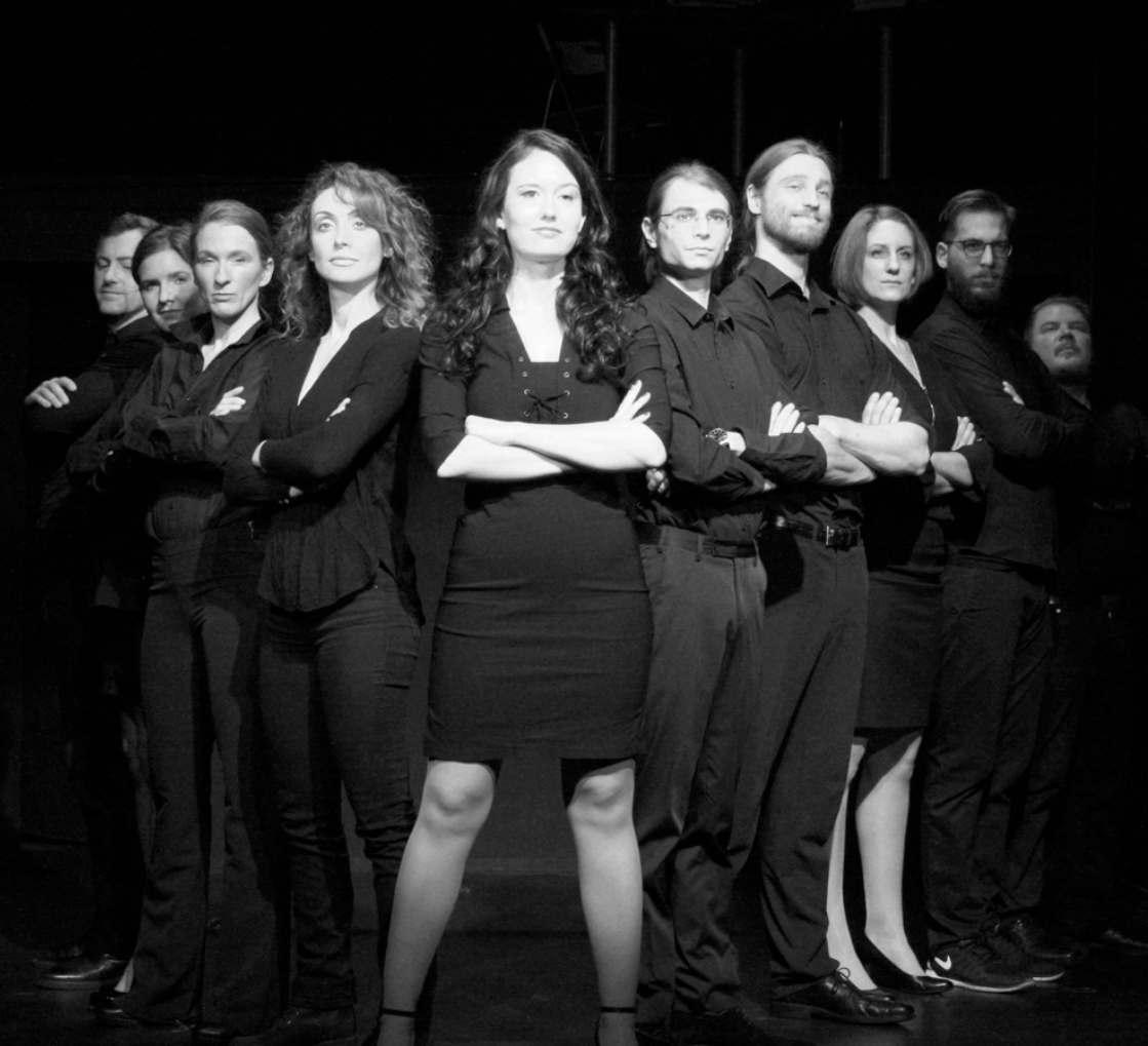
Probenbild "DREAMS INC."